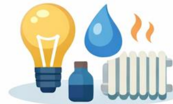
El, vand og varme