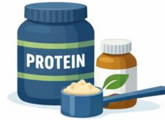
Kost- og diætpræparater