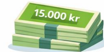
Øvrige udgifter over 15.000 kr