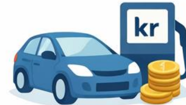
Befordring og driftsudgifter