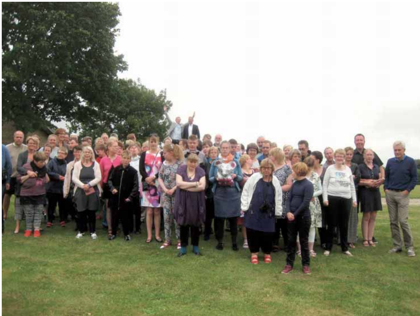
Deltagere på årets sommerlejr